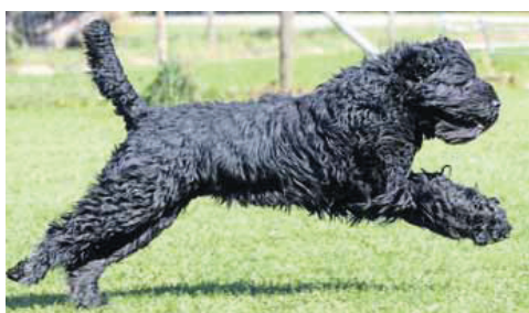
Kämpfen und siegen: Beim Hunderennen des Freisinger Vereins CaniFit laufen die Vierbeiner am Sonntag in mehreren Klassen um die Wette.

dem können Senioren unabhängig von der Größe in einer eigenen Klasse gemeldet werden. Meldungen werden ab sofort online entgegen genommen (info@canifit.de). Gegen Vorlage der Online-Meldebekräftigung am Tag des Rennens kostet der Start 5 Euro, kurzfristige Nachmeldungen am Tag der Veranstaltung kosten zwei Euro mehr. Bei der Anmeldung am Tag des Rennens muss der Impfpass vorgelegt werden. Nicht geimpfte Hunde sind auf dem CaniFit-Gelände nicht zugelassen. SZ